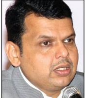
देवेन्द्र फडनवीस मुख्यमंत्री